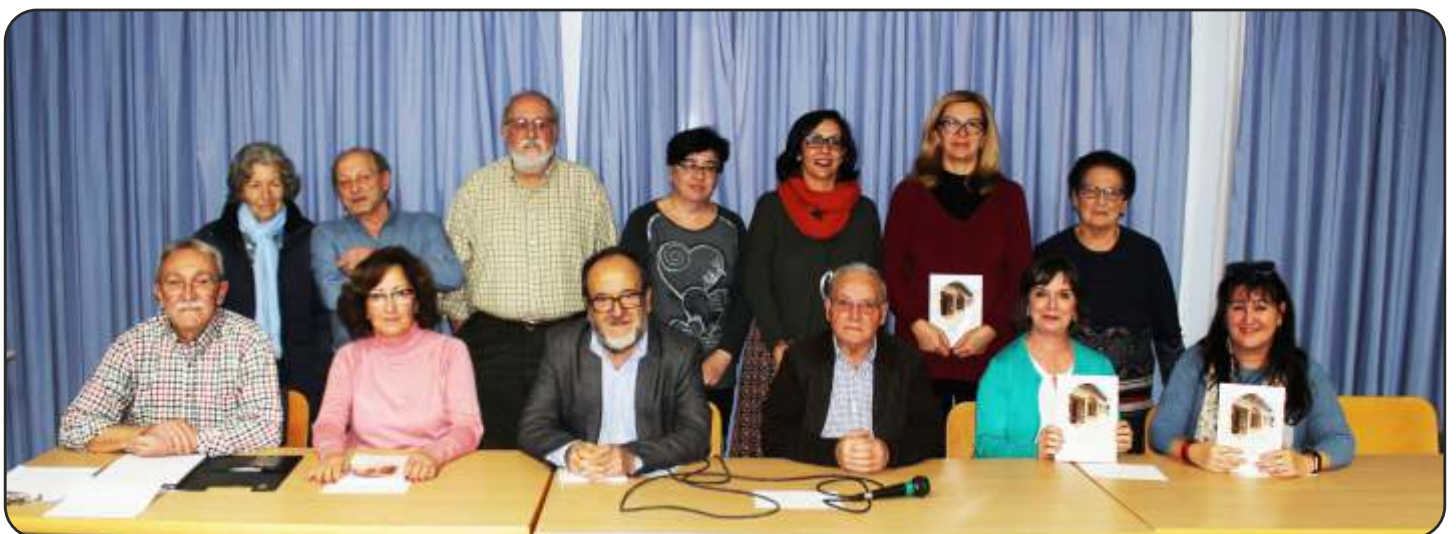
Colaboradores en la realización del libro.